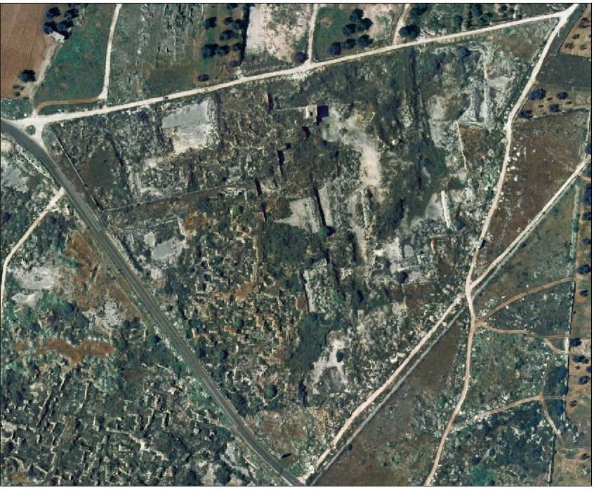
STATO DEI LUOGHI ESISTENTI Scala 1:1000