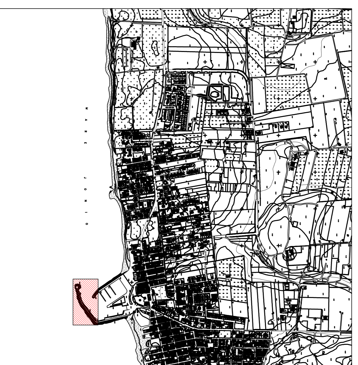
Stralcio aerofotogrammetrico scala 1:10000