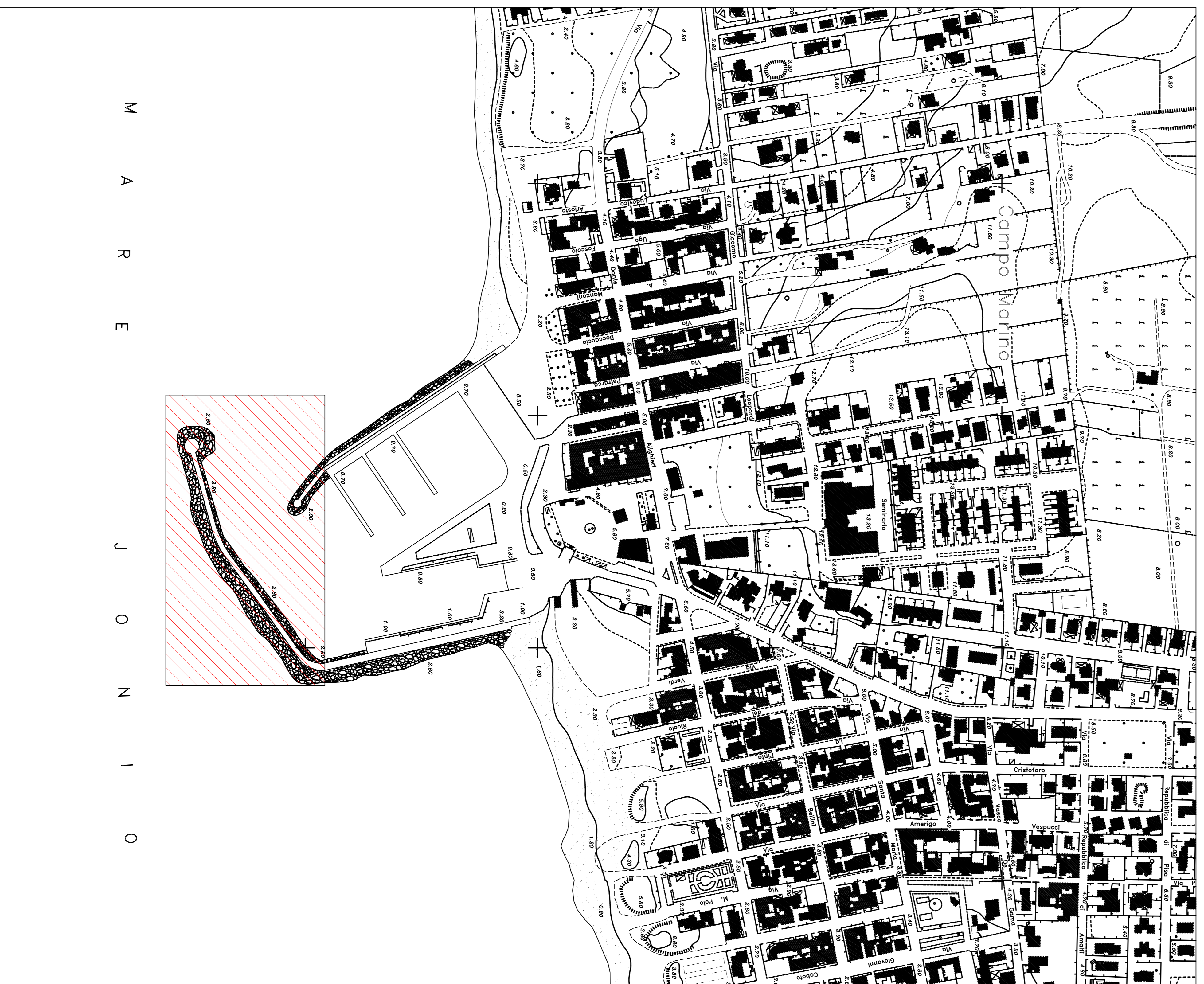
Stralcio aerofotogrammetrico scala 1:2000