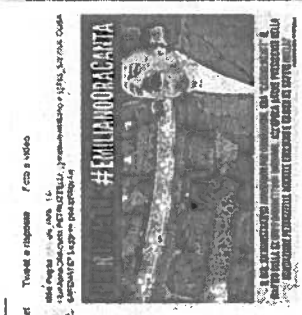
Il web l'hashtag lanciato dai grillini

Sul web l'hashtag lanciato dai grillini dei 5 Stelle» e poi chiarisce: «Non ho mai nominato il direttore amministrativo, che ho già trovato in quel ruolo quando sono stato eletto. La sua nomina risale a quando presidente